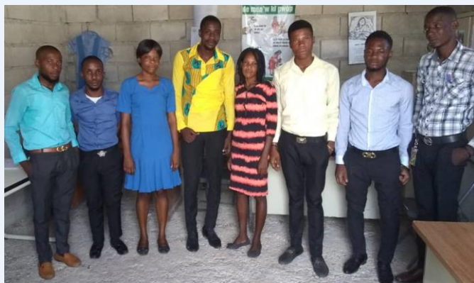
Lehrerschaft des FDC am 27. Okt. 2023.

proEducation: Wieso hat es aktuell weniger Kinder?